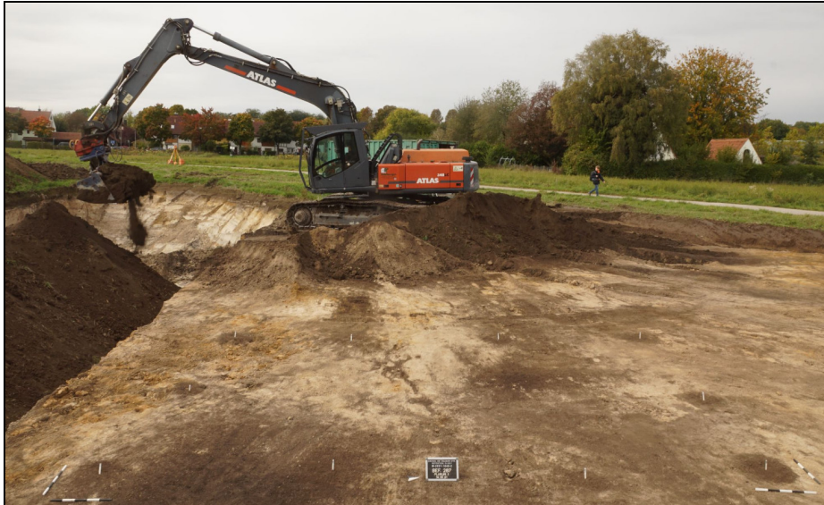
Abb. 2 Beim Oberbodenabtrag am Rennfeldweg kommt ein Pfostenbau zu Tage.

Siedlungsbefunde der aktuellen Grabungen beschränken sich auf den mittleren Westteil des Grabungsareals. Wenngleich die wenigen Pfostenbauten keine datierenden Funde erbrachten, ist mit Blick auf den mittelkaiserzeitlichen Brunnen eine Datierung in römische Zeit als sehr wahrscheinlich zu erachten. Pfosten eines Hauses schneiden außerdem einen der latènezeitliche Gräben. Offenbar wurde am Rennfeldweg ein Ausschnitt eines römischen Gutshofes in der für die Gegend typischen Holzbauweise erfasst. (Abb. 2, 3).