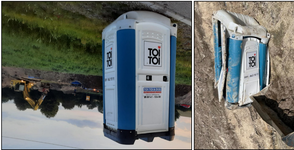
Abb. 4 Verkehrte Welt...

Wiederholt gab es Vandalismus auf der Grabung. Regelmäßig war die Mobiltoilette nach dem Wochenende umgeworfen oder gar auf den Kopf gestellt (Abb. 4).